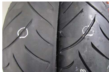
Michelin Pilot Road 2