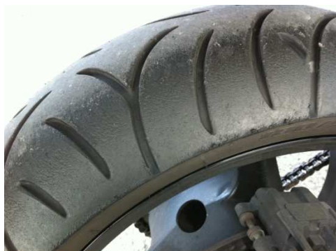
IDM-Profi auf BT021R

Tim war mit dem als griplos verrufenen alten BT021 auf der Bandit unterwegs, einer der Tester auf der BT023 bereiften Bandit.