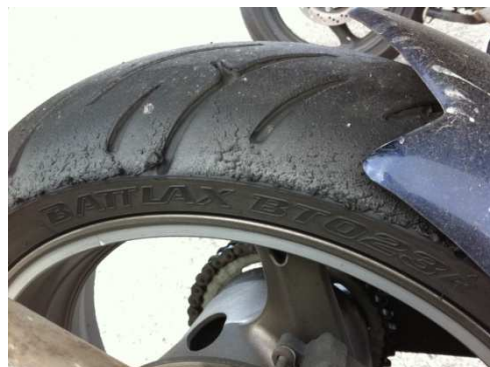
Rennsportamateur auf BT023R

Deutlich ist auf den Bildern zu erkennen: