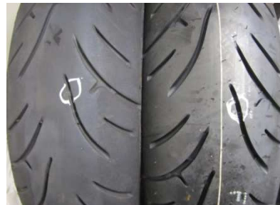
Continental Road Attack 2